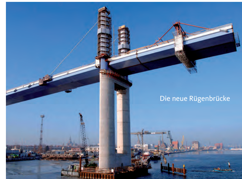
Die neue Rügenbrücke